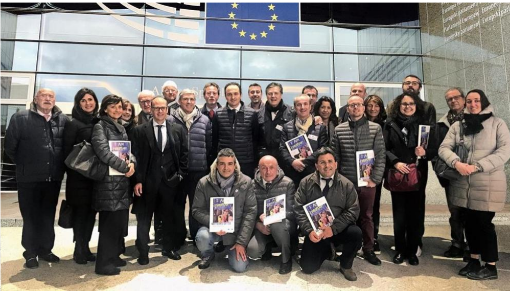
La delegazione cuneese a Bruxelles

A disposizione fino al 2020 per i Gruppi di azione locale